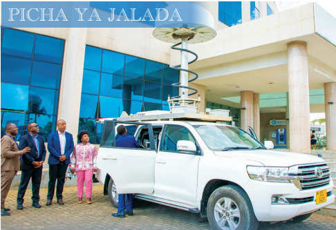
Gari la TCRA lenye mtambo wa kufuatilia matumizi na mwelekeo wa masafa ya mawasiliano.