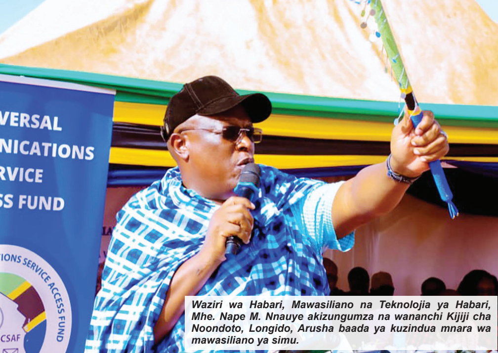
Waziri wa Habari, Mawasiliano na Teknolojia ya Habari, Mhe. Nape M. Nnauye akizungumza na wananchi Kijiji cha Noondoto, Longido, Arusha baada ya kuzindua mnara wa mawasiliano ya simu.

mikoa yote hadi kufikia mwishoni mwa mwaka 2032.